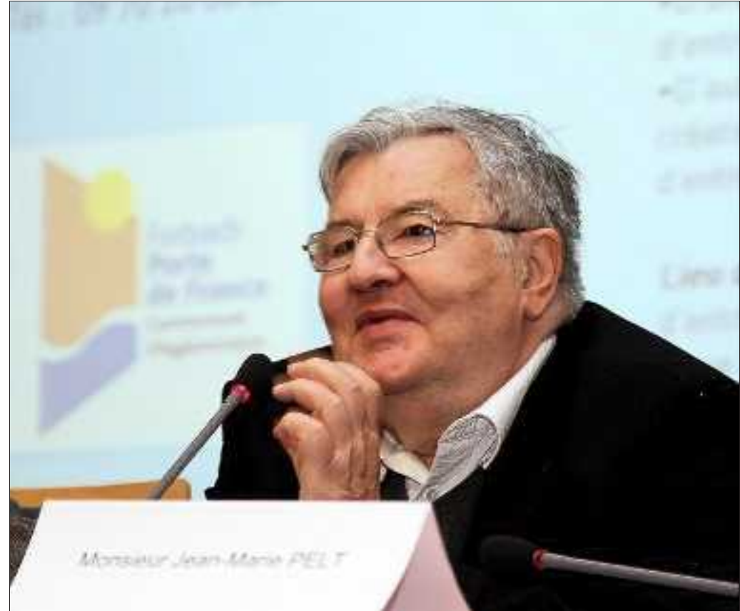
Durant plus d'une heure, Jean-Marie Pelt a captivé l'auditoire sur le thème "L'évolution : que savons-nous de ses limites et des liens insoupçonnés entre les espèces ?"