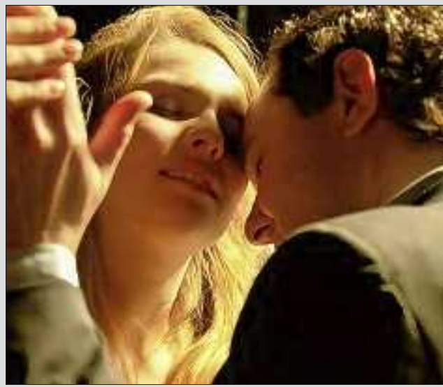
Barbe-bleue, espoir des femmes est une pièce de théâtre, de Dea Loher, auteure allemande contemporaine.

Le Carreau Scène nationale propose aujourd'hui et demain à 20 h au Cac de Forbach, la pièce de théâtre Barbe-bleue, espoir des femmes , de Dea Loher. Dans le conte de Perrault, Barbe-bleue tue les femmes pour les punir de leur curiosité. Chez Dea Loher, auteure allemande contemporaine, il est vendeur de chaussures. Il tue les femmes parce qu'elles cherchent un amour au-delà de toute mesure. Barbe-bleue, espoir des femmes tord le cou au romantisme. A la fois drôle et profonde, cette version moderne de la légende de l'homme qui assassina sept femmes nous confronte à une seule énigme : qui est-on face à l'autre ? Tarifs de 6 à 20 €. Réservations au Cac de Forbach de 14 h à 18 h, au 03 87 84 64 34. Jeudi 31 mars et vendredi 1er avril à 20 h au Cac de Forbach.