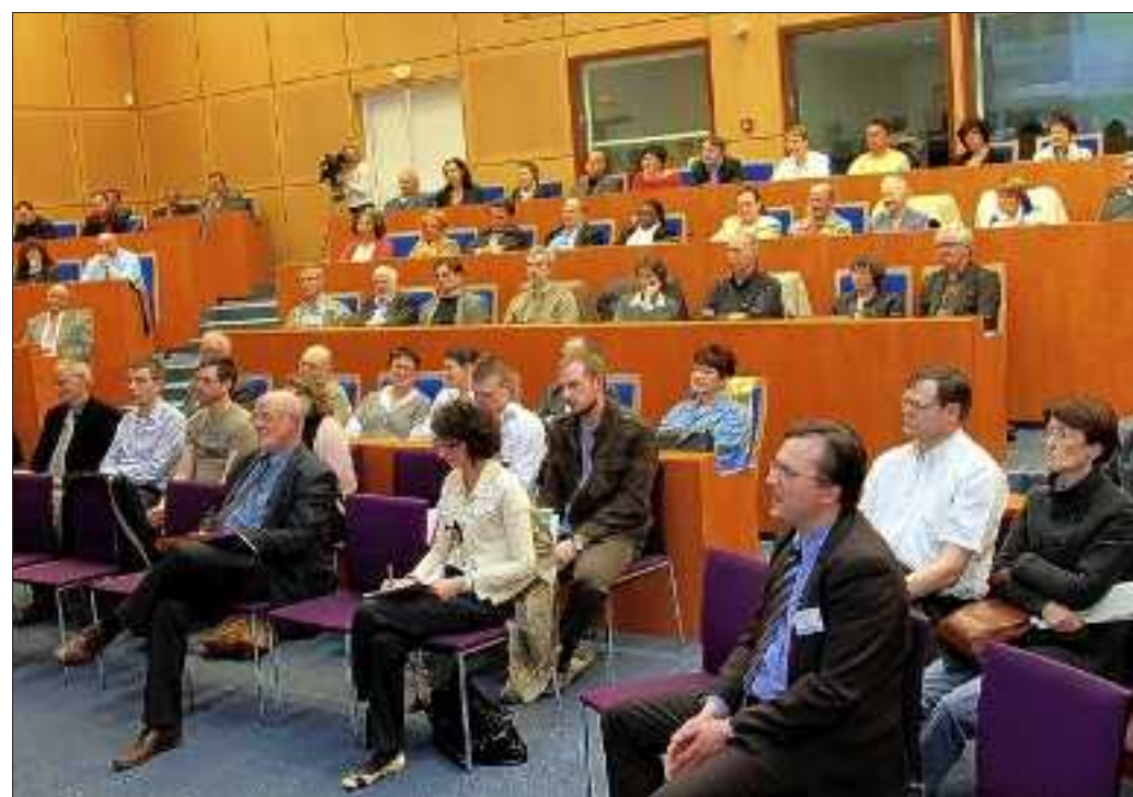
La centaine de participants ont salué unanimement les qualités d'orateur de Jean-Marie Pelt.

le député, les pensions de retraite augmenteront au 1er avril de 2,1 %. L'inflation se situera à 1,8 %, comme Christine Lagarde l'a annoncé. Il y a donc 0,3 % de rattrapage, conformément à l'engagement que j'ai fait lors de la campagne électorale. Quant au minimum vieillesse, il augmentera de 4,7 % au 1er avril. Nous avons pris l'engagement de le revaloriser de 25 % sur cinq ans : cet engagement est tenu. Encore une fois, il s'agit d'une garantie de pouvoir d'achat. Les 600 000 titulaires d'une pension de réversion ont également bénéficié d'une revalorisation. En tous ces domaines, nous veillons à ce que l'inflation n'entame pas le pouvoir d'achat des retraités. [...] »